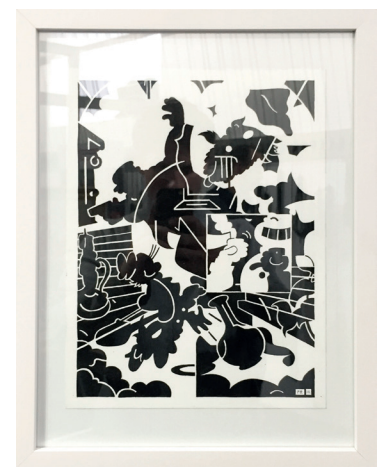
Paul Riedmüller „Meeting“ 2015 Ink on paper, framed 24x32cm 450,-