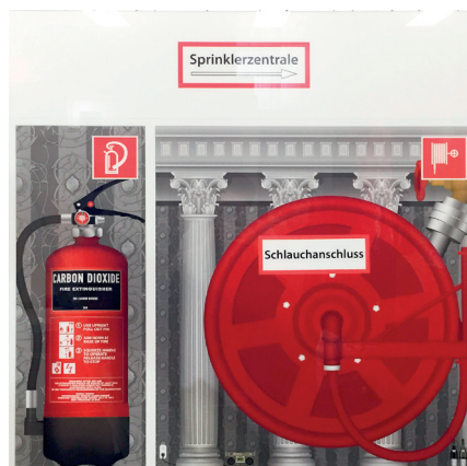
Heidi Popovic „Foyer“ 2015 Pigment print 90x90cm 4000,-