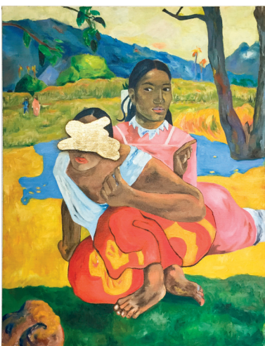
Sebastian Schager „Nafea faa ipoipo?“ 2015 Oil on canvas, gold leafed 101*77cm 1200,-