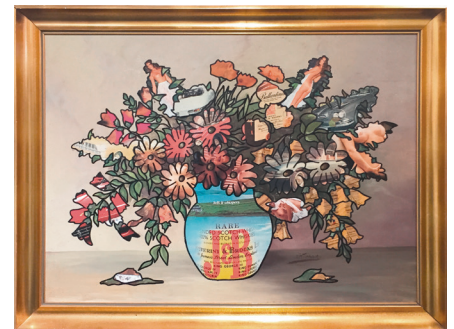
Ben Reyer „Men's world“ 2014 Collage on found Object 90x70cm, framed 2300,-