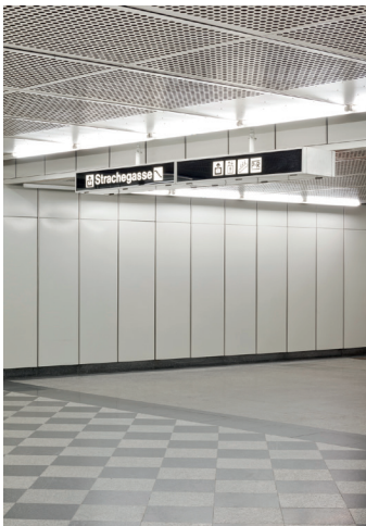
Andreas Nader „Strachegasse“ 2015 Pigment print, ed. 10 42x60cm 400,-