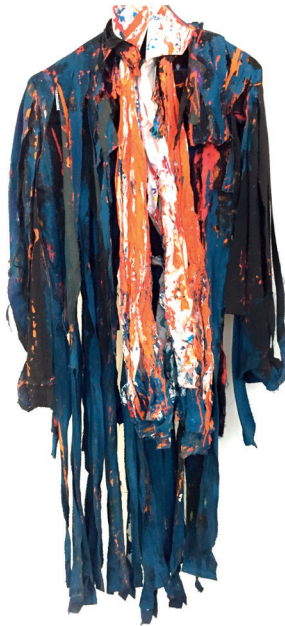
Alfredo Ledesma „Suit“ 2015 Cut clothes, latex paint 140x50cm 900,-